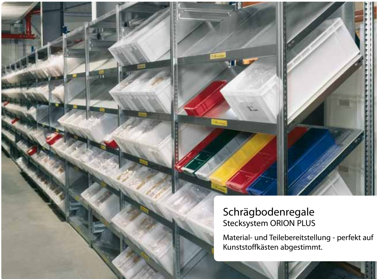
Schrägbodenregale Stecksystem ORION PLUS Material- und Teilebereitstellung - perfekt auf Kunststoffkästen abgestimmt.