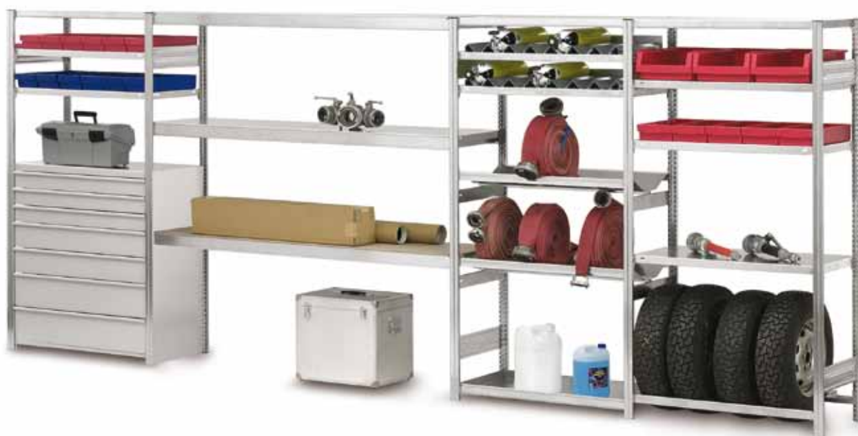
Beispiele für Systemlösungen: Bei gleicher Tiefe kompatibel mit allen anderen Regalen des Stecksystems ORION PLUS

Alle Zusatzböden inklusiv je 4 Fachbodenträgern.